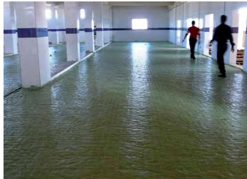
La savonnerie d'Alep de nov. à fév. la découpe du savon