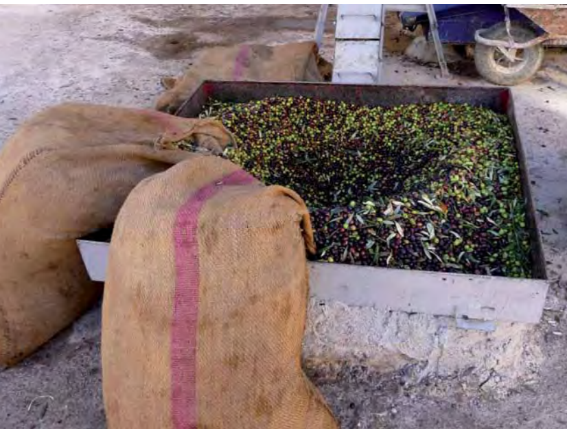
Au moulin à huiles août la récolte des olives

NOUS SOMMES PRODUCTEUR DE NOS PROPRES MATIÈRES PREMIÈRES, C'EST UNE RÉELLE ASSURANCE SUR LA COMPOSITION DES PRODUITS COSMÉTIQUES QUI VOUS SONT PROPOSÉS SOUS LA MARQUE NAJEL. NOUS SOMMES ENTIÈREMENT SPÉCIALISÉS DANS LE PROCESSUS DE FABRICATION.