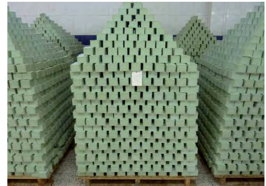
La savonnerie d'Alep de fév. à sept. le séchage du savon

WE PRODUCE OUR OWN RAW MATERIALS, WHICH GIVES TOTAL ASSURANCE AS TO THE CONTENTS OF THE COSMETIC PRODUCTS THAT ARE AVAILABLE UNDER THE NAJEL BRAND. WE ARE ENTIRELY SPECIALIZED IN THE MANUFACTURING PROCESS.